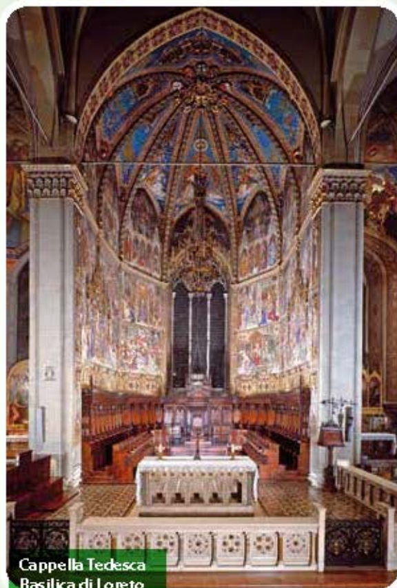
Cappella Tedesca Basilica di Loreto

Merita attenzione la serie delle Cappelle absidali della basilica di Loreto, intitolate alla fine dell'Ottocento e nella prima metà del Novecento ad alcune Nazioni d'Europa. Ciò avvenne durante il piano generale di ristrutturazione e decorazione delle absidi della basilica, su suggerimento del cappuccino spagnolo padre Pietro da Malaga, direttore della Congregazione Universale della Santa Casa, con l'intento di mettere in risalto l'universalità del santuario lauretano e di consolidarne la devozione nei Paesi europei.