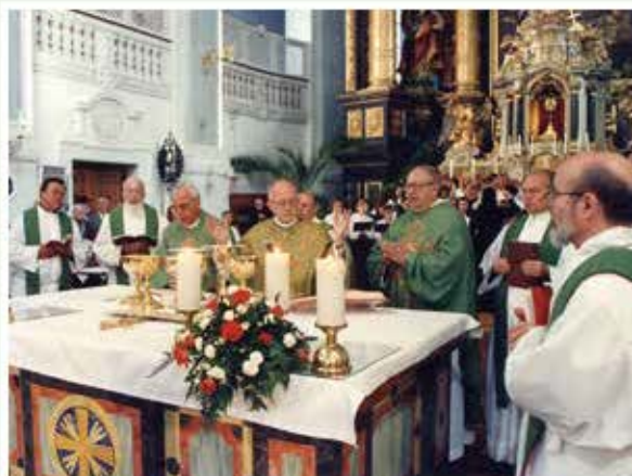
Un momento del Solenne Pontificale in occasione del Gemellaggio Loreto - Altoetting.