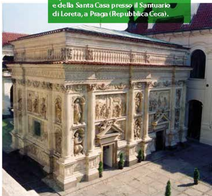
Riproduzione del rivestimento marmoreo e della Santa Casa presso il Santuario di Loreto, a Praga (Repubblica Ceca).

esempi pregevoli di arte barocca, oggi giustamente rivalutati. Il più celebre e il più pregevole sul piano artistico a riguardo è il "Loreto" di Praga, nella Repubblica Ceca, costruito negli anni 1626-1631 con la fedele riproduzione dell'interno della Santa Casa, alla quale fu aggiunto nel 1664 il rivestimento in stucco, modellato alla perfezione su quello marmoreo del santuario di Loreto. Si tratta di un capolavoro di arte, oltre che di una viva testimonianza di devozione mariano-lauretana.